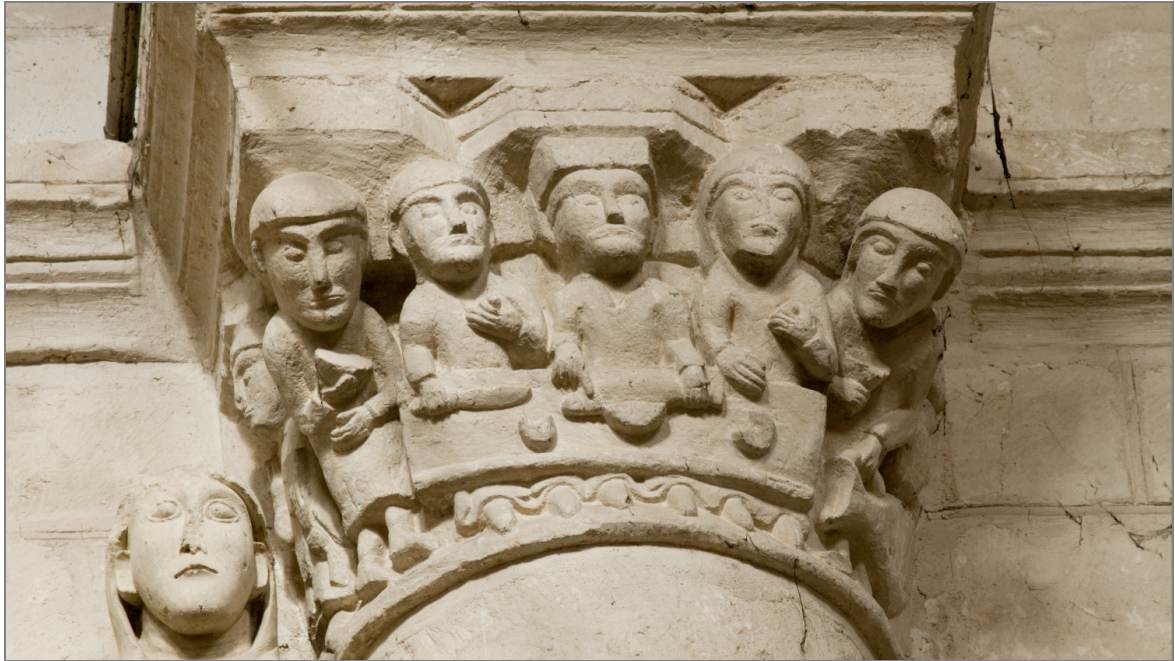
Illustration 3 : Scène de repas (Noces de Cana?). Chapiteau de l'église d'Airvault (Deux-Sèvres).