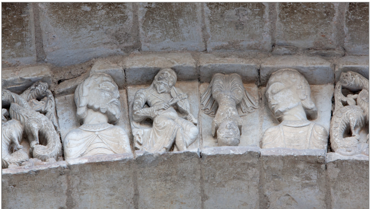
Illustration 4 : Musicien (joueur de vièle) et acrobate. Façade de l'église de Civray (Vienne).