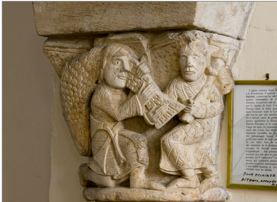
Illustration 5 : Scène énigmatique avec personnages vêtus comme des bourgeois. Église de Saujon (Charente-Maritime).