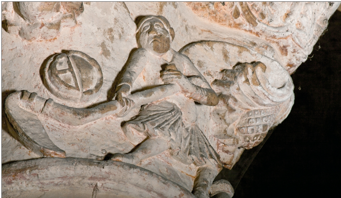
Illustration 1 : Un paysan en train de faucher. Chapiteau de l'église d'Airvault (Deux-Sèvres).