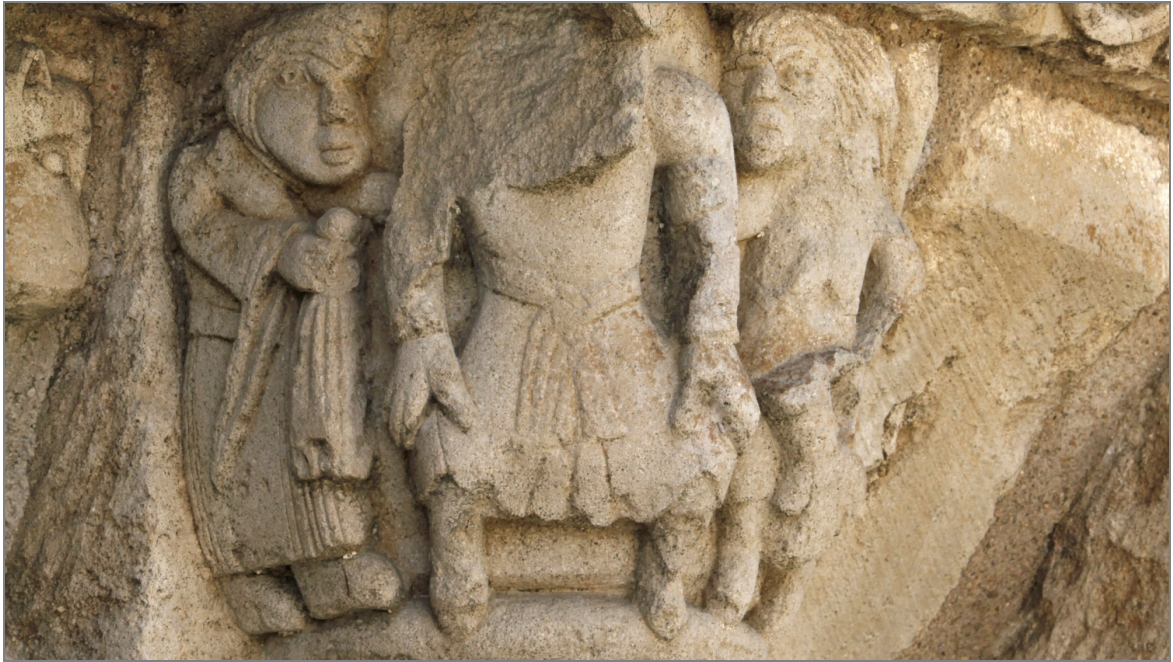
Illustration 7 : Serviteurs (?) autour d'un personnage assis. Église de Vaux (Vienne).