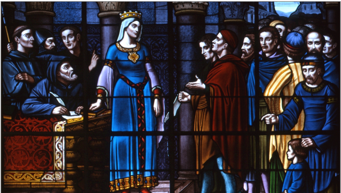
Illustration 8 : Aliénor donnant la chartre de commune aux habitants de Poitiers. Vitrail 19 e s., hôtel de ville de Poitiers.