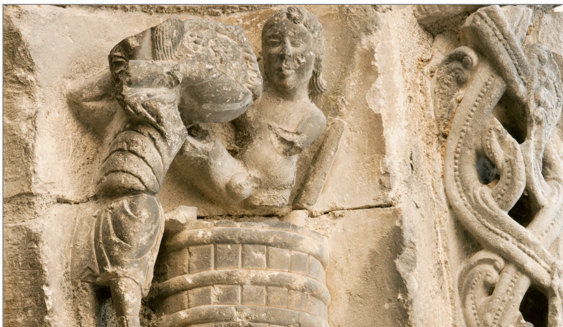
Illustration 2 : Le foulage du raisin, au mois de septembre. Zodiaque et travaux des mois de l'église de Civray (Vienne).