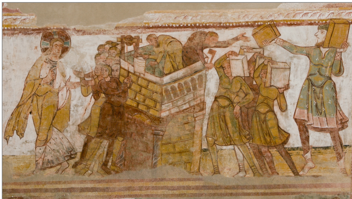
Illustration 6 : Construction de la Tour de Babel : maçons, manœuvres, architecte... Abbaye de Saint-Savin (Vienne).