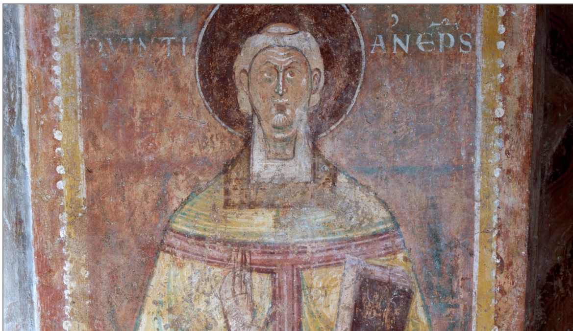
Illustration 2 : Une peinture murale représentant un évêque. Église Saint-Hilaire de Poitiers (Vienne). A. Maulny, 1983.