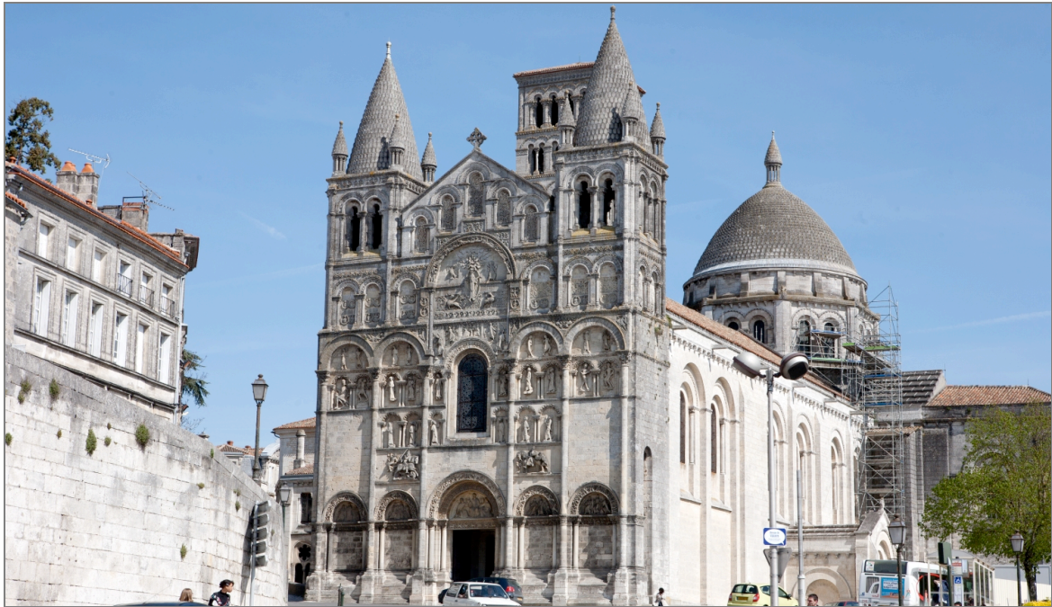
Illustration 1 : La cathédrale romane Saint-Pierre d'Angoulême (Charente), construite par l'évêque Girard II.