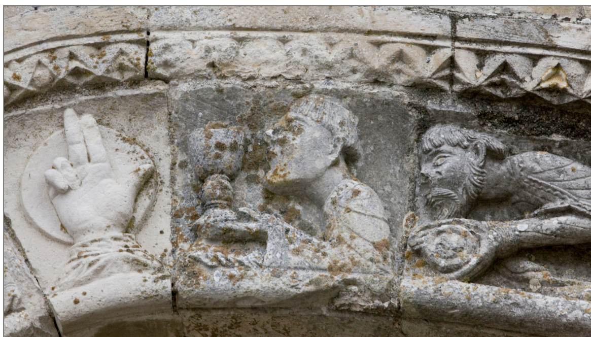
Illustration 4 : Religieux avec un calice et une patène, objets de la messe. Église de Champagne-Mouton (Charente).