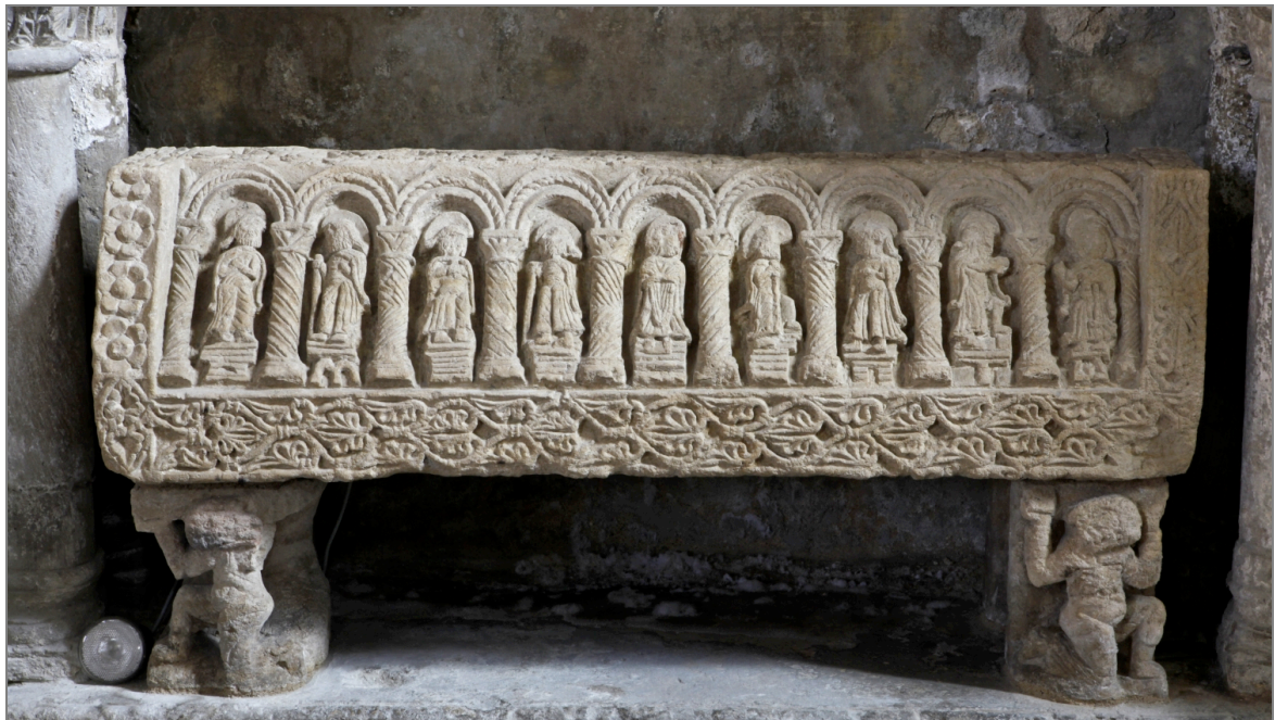
Illustration 7 : Tombeau de Pierre de Saine-Fontaine, abbé réformateur de l'abbaye d'Airvault. Église d'Airvault (Deux-Sèvres).