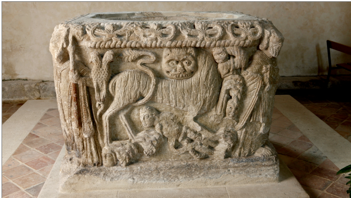
Illustration 5 : Une cuve destinée au baptême, du 12 e siècle. Église d'Ars (Charente).