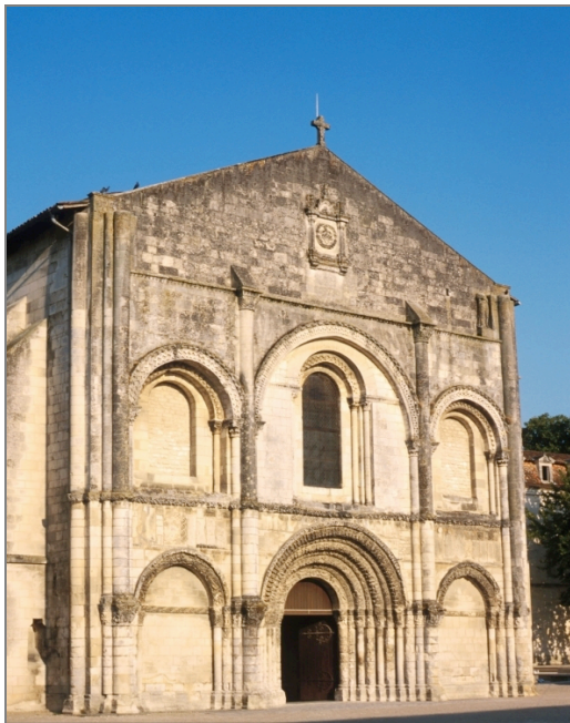
Illustration 9 : Église de l'abbaye aux Dames, monastère féminin fondé vers 1047 à Saintes (Charente-Maritime).