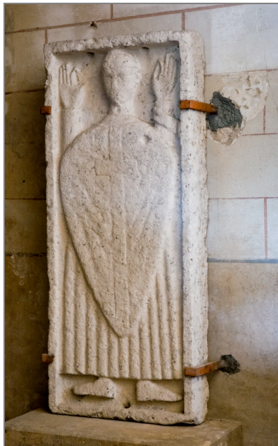
Illustration 3 : Une pierre tombale représentant un prêtre priant, les mains levées. Église d'Anché (Vienne).