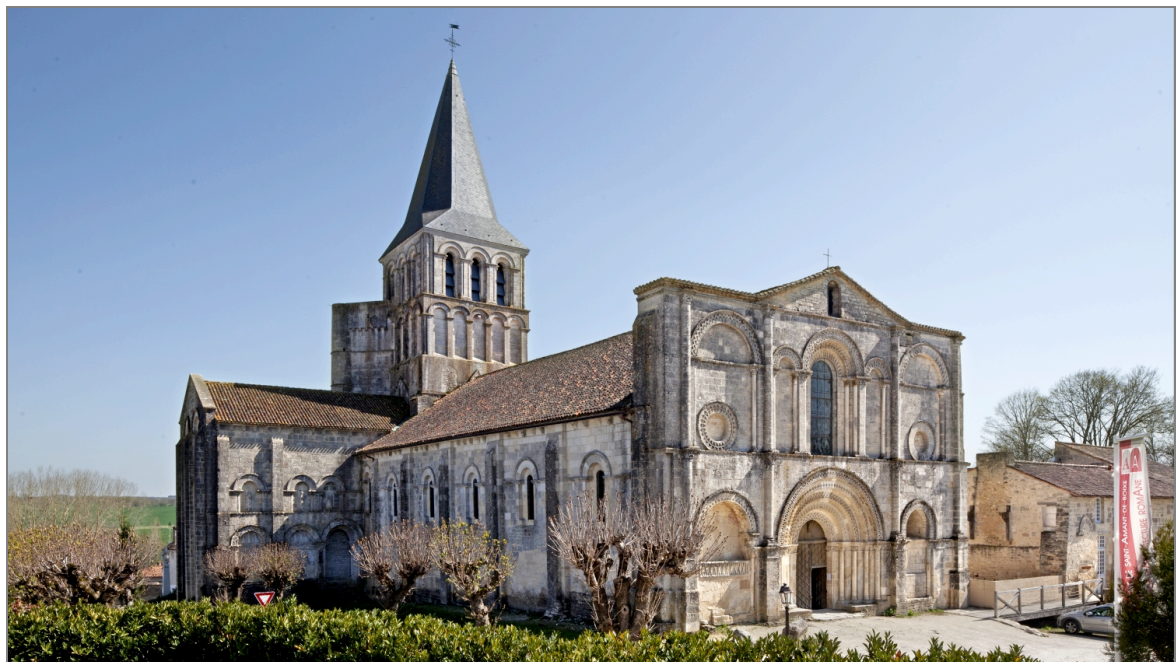
Illustration 8 : Église de l'abbaye de Saint-Amant-de-Boixe (Charente), reconstruite au 12 e siècle.