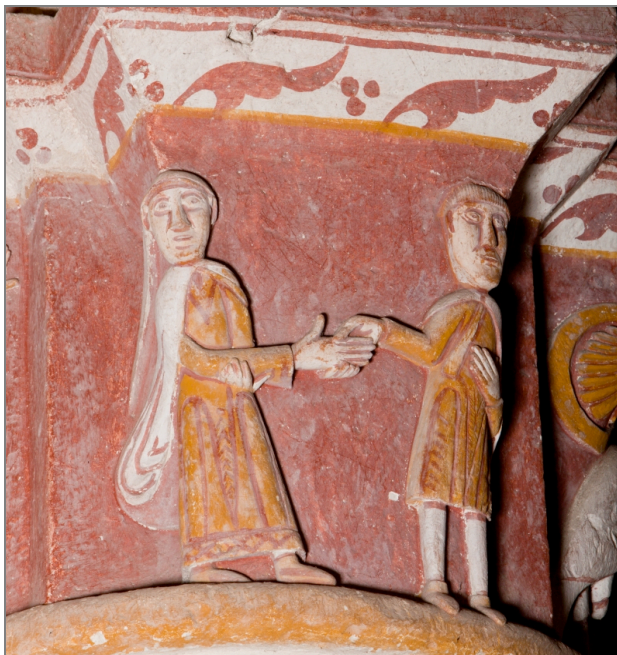
Illustration 6 : Scène de mariage qui, à partir du 12 e siècle, devient une cérémonie religieuse. Église de Civaux (Vienne).